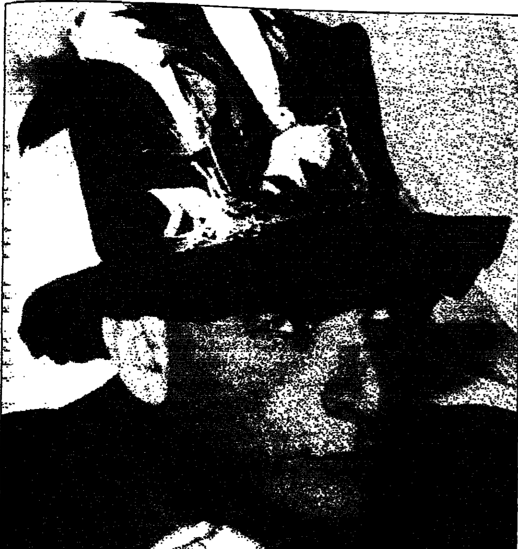
محيي اسماعيل (القديس العربي)

سافرت الى القاهرة وتركت العرض... ولكن قبل سفرتي ذهبت الى قسم الشرطة... الخ